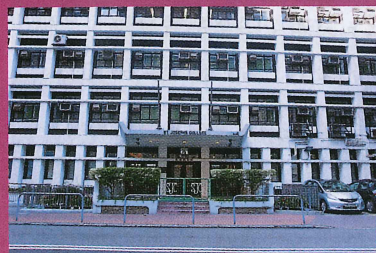
▲聖若瑟英文書院是一間著名的男校，學生成績卓越之餘，課外活動同樣出色。

申請日期： 即日起至1月22日 地址： 中環堅尼地道7號 電話： 3652 4888 網址： http://www.sjc.edu.hk