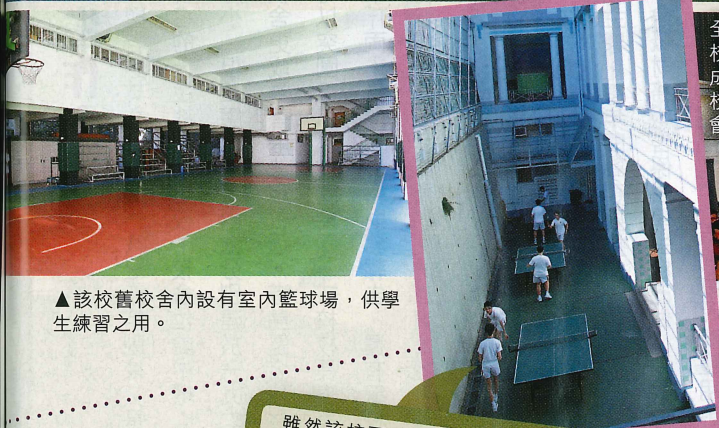
▲該校舊校舍內設有室內籃球場，供學生練習之用。

全港第一隊軍軍隊是該校校友於一九一三年組成，去年校友們返回母校參加大型百周年盛會，場面盛大。